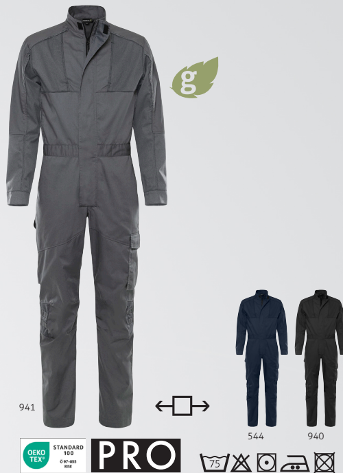
Green Overall 8930 GWM Art.Nr. 301028

MATERIAL 65 % recyceltes Polyester, 35 % Baumwolle, mechanischer Stretch-Twill GEWICHT 245 g/m 2 FARBE 544 Dunkelmarine, 557 Dunkelmarine/Warnschutz-Gelb, 587 Dunkelmarine/Grau, 866 Grau/Rot, 896 Grau/Schwarz, 940 Schwarz GRÖSSE C44-C62, D84-D120 GRÖSSE DAMEN C34-C50