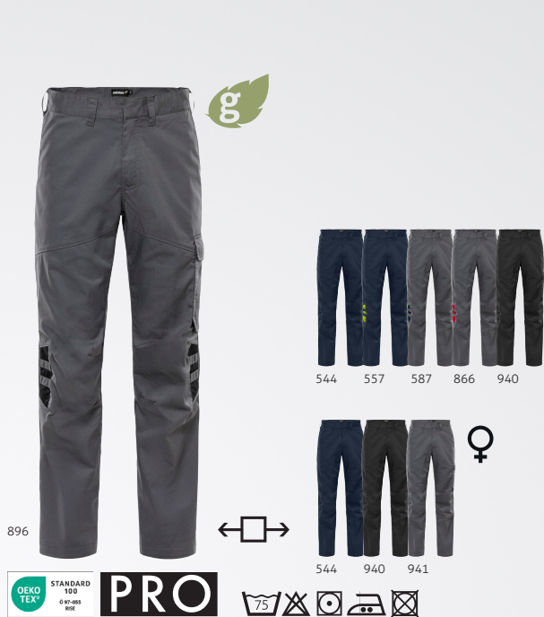
Green Hose Herren 2930 GWM Art. Nr. 301026 Green Hose Damen 2931 GWM Art.-Nr. 301236

Teilweise recyceltes Material / Mechanischer Stretch / Rippenstrick-Stretcheinsätze in der Taille / Verdeckter Knopf vorne / 2 Vordertaschen / 2 Gesäßtaschen / Zollstocktasche und Werkzeugtasche / Beintasche mit Schlaufe für Ausweishalter, Patte mit verdecktem Druckknopfverschluss / Vorgeformte Knie / Verstellbare Beinlänge mit 5 cm Saumzugabe / OEKO-TEX® zertifiziert