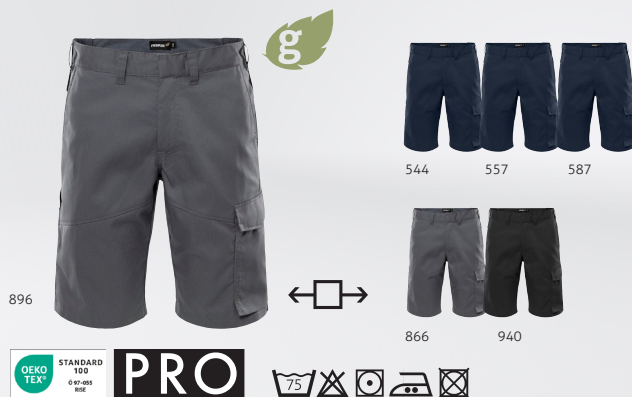
Green Shorts 2932 GWM Art.Nr. 301235

MATERIAL 65 % recyceltes Polyester, 35 % Baumwolle, mechanischer Stretch-Twill GEWICHT 245 g/m 2 FARBE 544 Dunkelmarine, 940 Schwarz, 941 Dunkelgrau GRÖSSE C44-C62, D84-D120