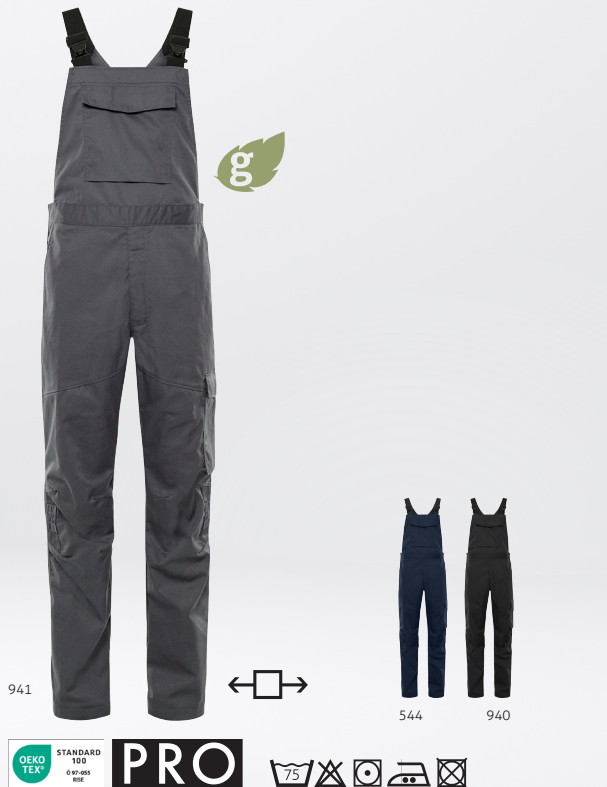
Green Latzhose 1930 GWM Art. Nr. 301027

MATERIAL 65 % recyceltes Polyester, 35 % Baumwolle, mechanischer Stretch-Twill GEWICHT 245 g/m 2 FARBE 544 Dunkelmarine, 940 Schwarz, 941 Dunkelgrau GRÖSSE XS-3XL